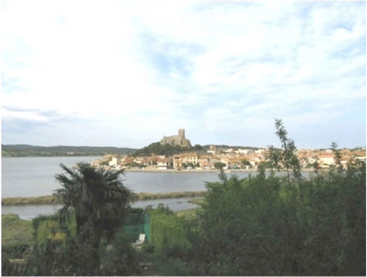
Tour Barberousse année 2007