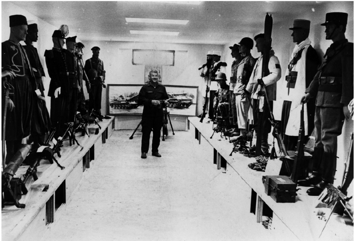
Une partie de l'intérieur du Musée, années 1970 ...